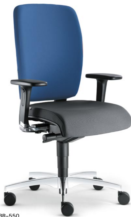
370. + BR-550