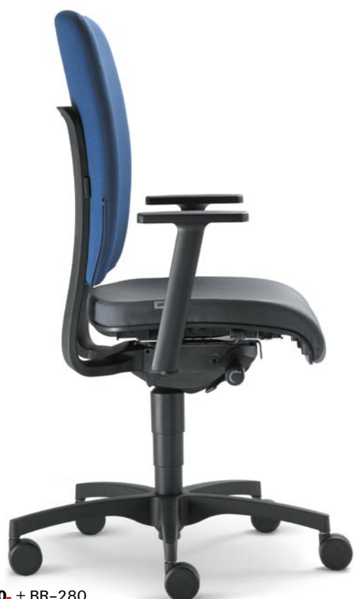
370. + BR-280